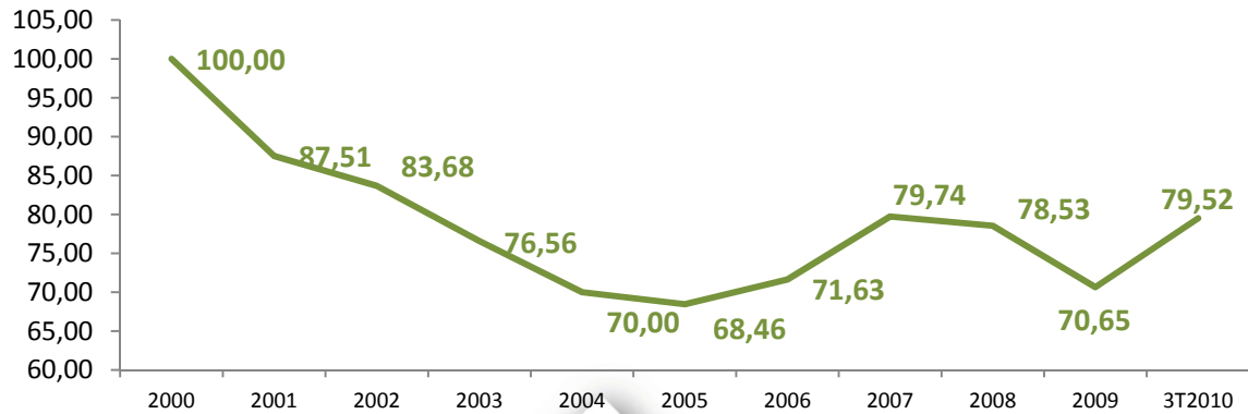
Precios de Papel IBG, Indices base 100 año 2000

El coste de aprovisionamiento se sitúa en 59.864 miles de Euros, aumentando un 10,2%. Incremento que tiene su origen principalmente en el mayor consumo de fibra larga y madera.