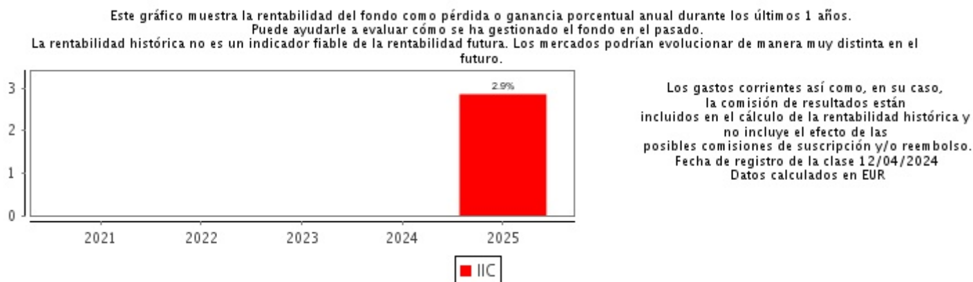
Gráfico rentabilidad histórica

Datos actualizados según el último informe anual disponible.