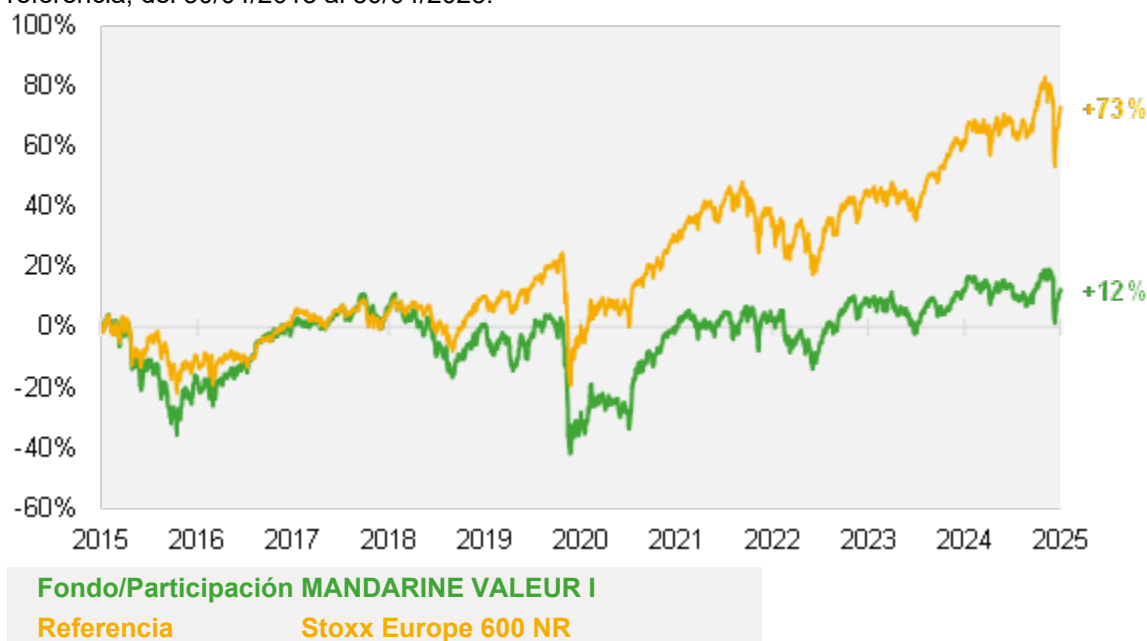
Gráfico comparativo del Fondo Absorbente MANDARINE EQUITY INCOME y de su índice de referencia, del 30/04/2015 al 30/04/2025:

Gráfico comparativo del Fondo Absorbido MANDARINE VALEUR y de su indicador de referencia, del 30/04/2015 al 30/04/2025: