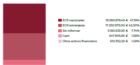
Distribución por tipo de activo