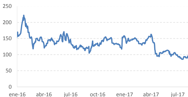
Gráfico 2: Evolución del diferencial entre el CDS subordinado y el CDS senior a 5 años sobre Banco Santander

Como se puede observar en el gráfico anterior, en las últimas semanas del mes de abril y las primeras del mes de mayo, el diferencial se estrechó de manera significativa bajando desde niveles superiores a 150 pb a niveles por debajo de 100 pb.